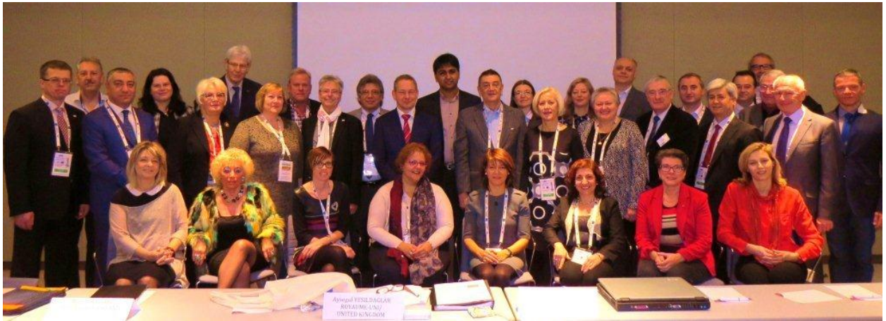
Les Membres du Comité Directeur à l'Hôtel Crowne Plaza à Belgrade (SRB).