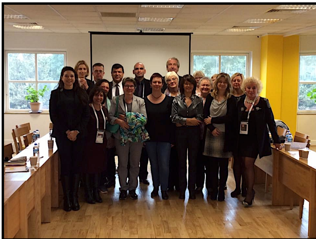
Les membres du Comité Directeur lors des 29èmes Rencontres annuelles de l'AEHT à la Docklands Academy London (DAL)