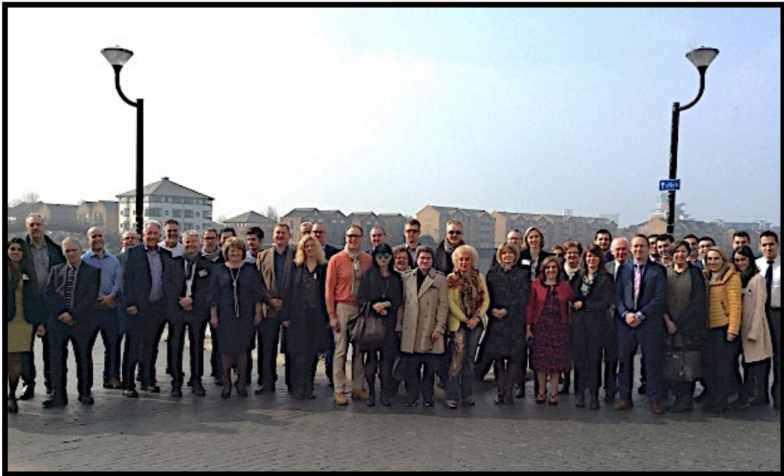
Les membres du Comité Directeur entourés des juges en chef et de l'équipe organisatrice des 29èmes Rencontres annuelles de l'AEHT rassemblés sur les docks à proximité de la Docklands Academy London (DAL)