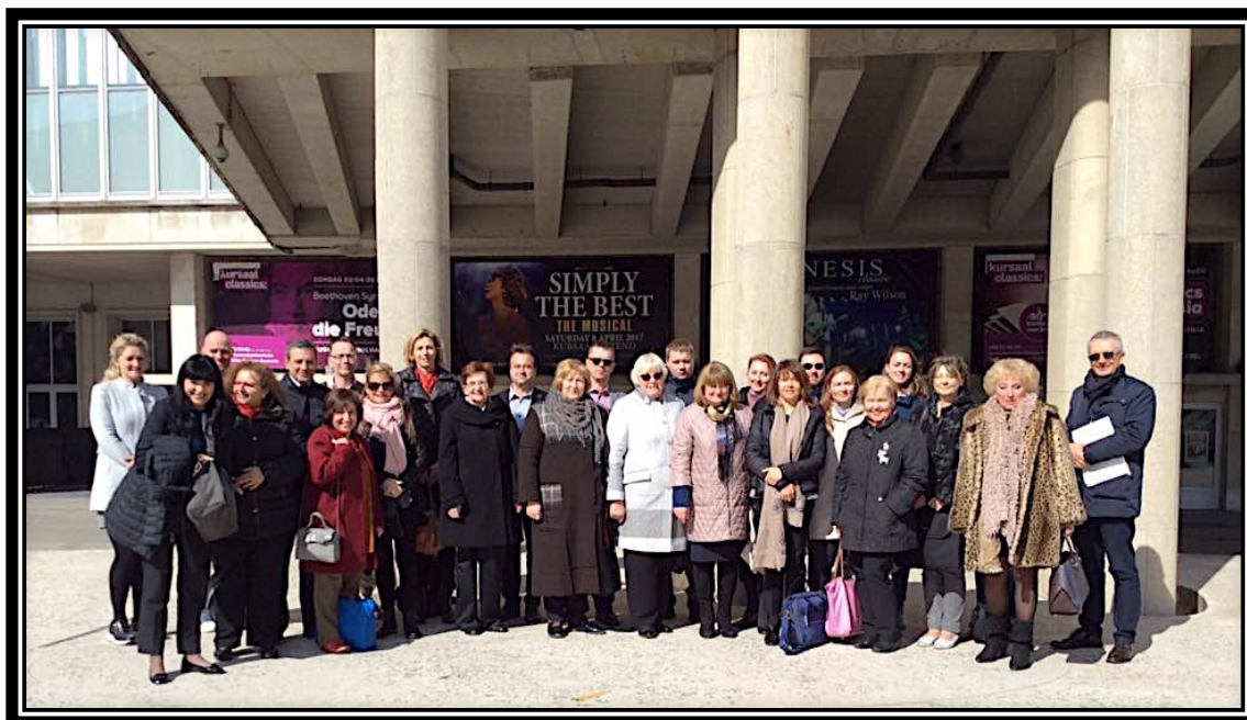
Les membres du Comité Directeur ainsi que les juges en chef et l'équipe organisatrice des Rencontres, réunis devant la Kursaal à Ostende – lieu des 30èmes Rencontres Annuelles de l'AEHT.